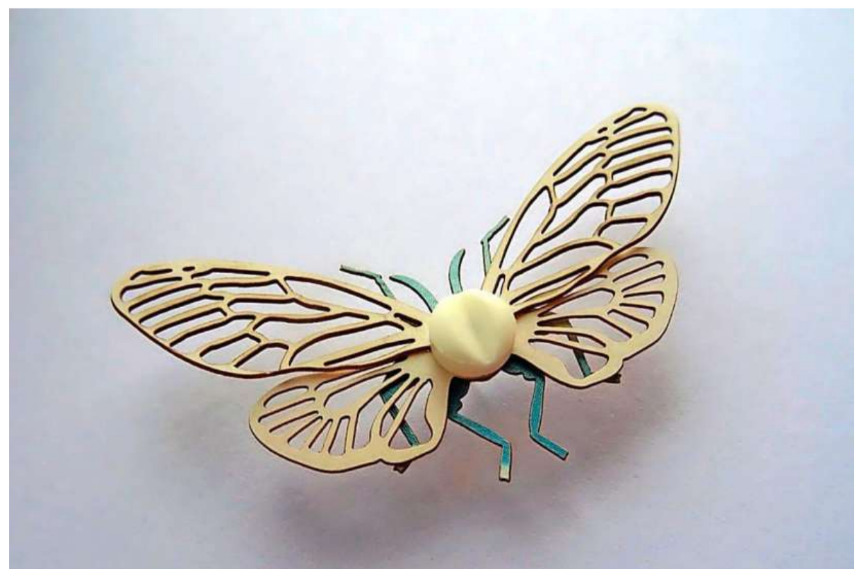
Cicadetta zopiclon, Merel Slootheer