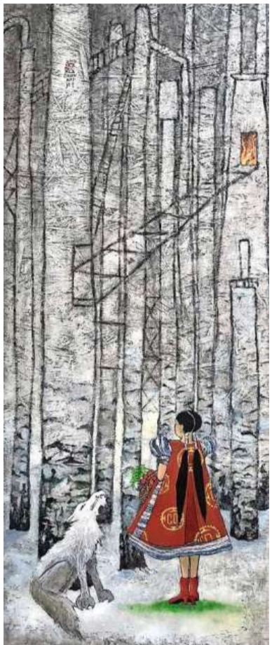
Roodkapje, Larissa Neslo